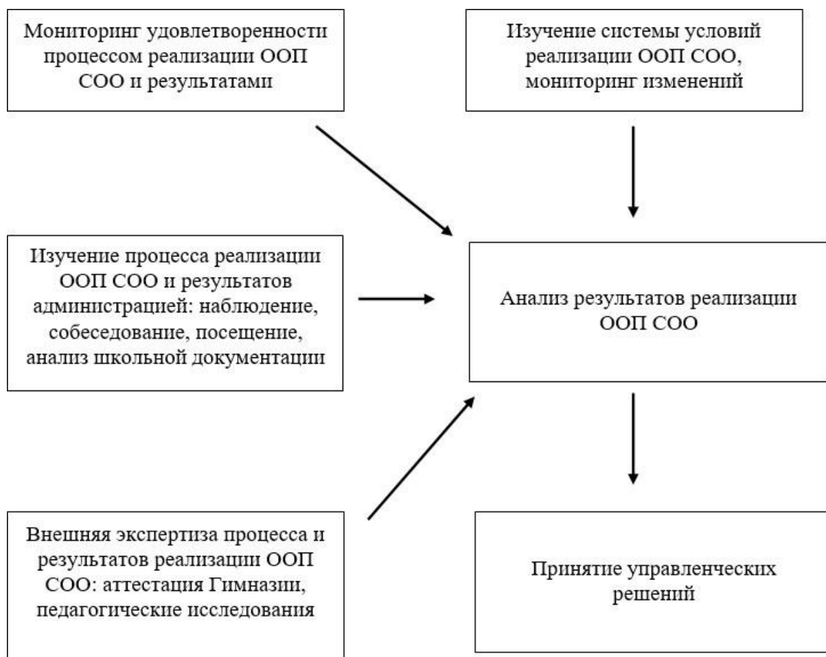
Схема. 1. Механизм принятия управленческих решений

Механизм принятия управленческих решений и обеспечение общественного участия и учета интересов, потребностей участников образовательных отношений, связанных с повышением эффективности реализации ООП, отражен на схеме 1.