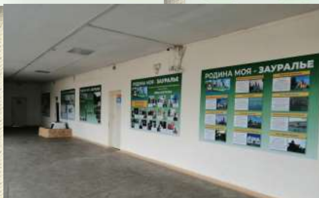
Рекреация третьего этажа возле школьного музея