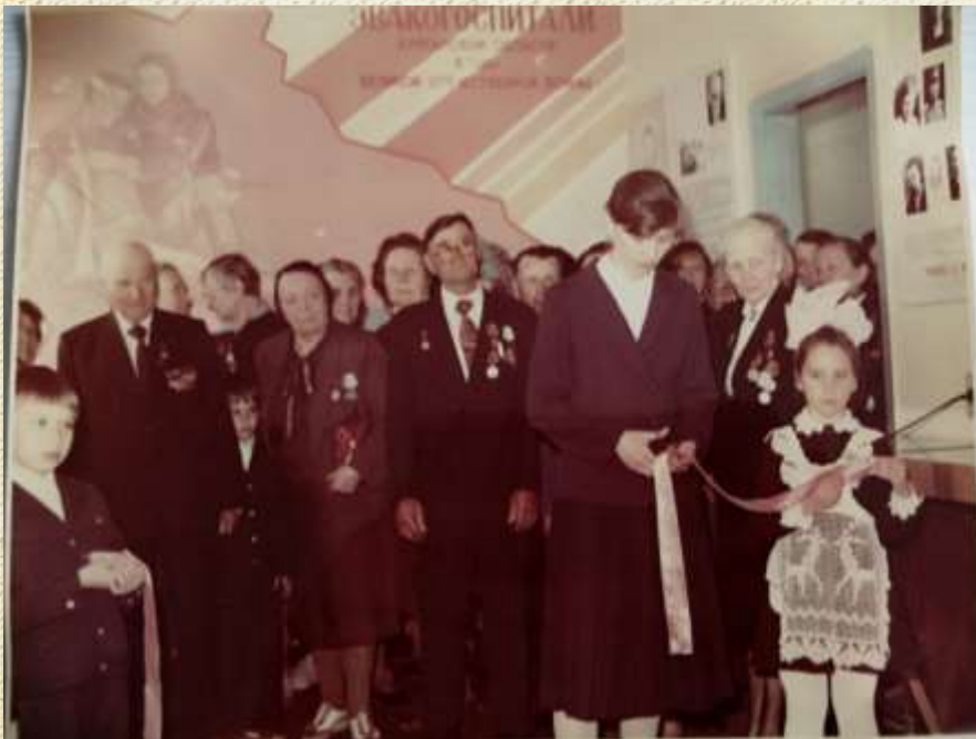
Открытие музея «Эвакогоспитали Курганской области в годы Великой Отечественной войны»

История музея началась с момента открытия школы в 1987 году. В школе располагался музей эвакогоспиталей времен ВОВ, который вскоре переехал в другое здание.