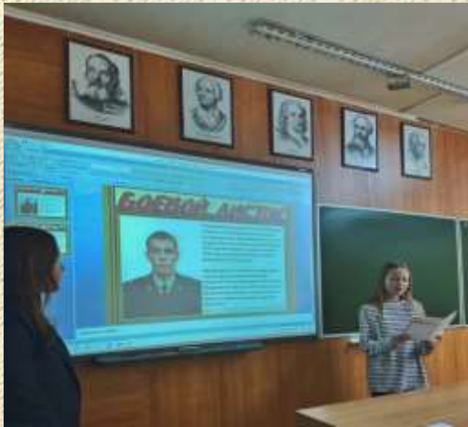
Учащиеся 11 класса рассказывают о герое