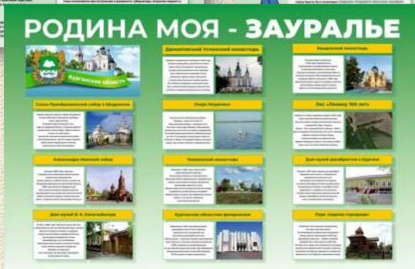
Баннер: достопримечательности Курганской области