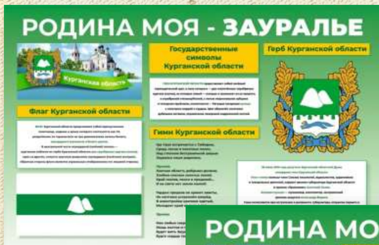
Баннер: символы Курганской области