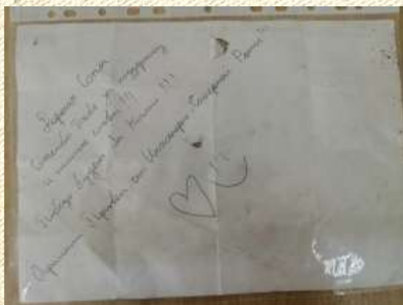
Письмо солдату, хранящееся в школьном музее