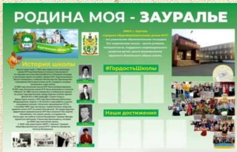
Баннер: история школы