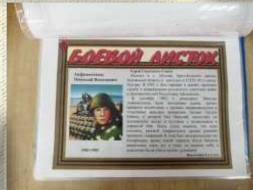
Альбом с героями Курганской области хранится в школьном музее и будет пополняться каждый год