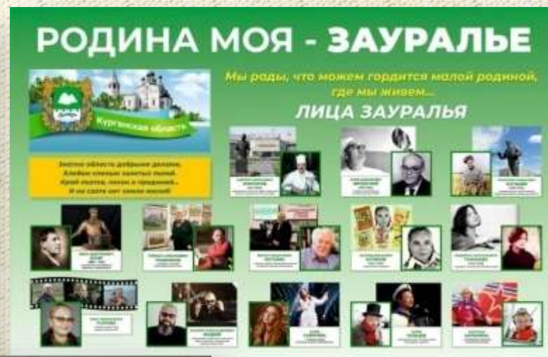
Баннер: знаменитые люди Зауралья