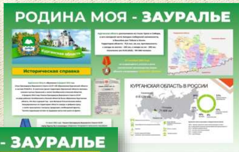
Баннер: история создания Курганской области